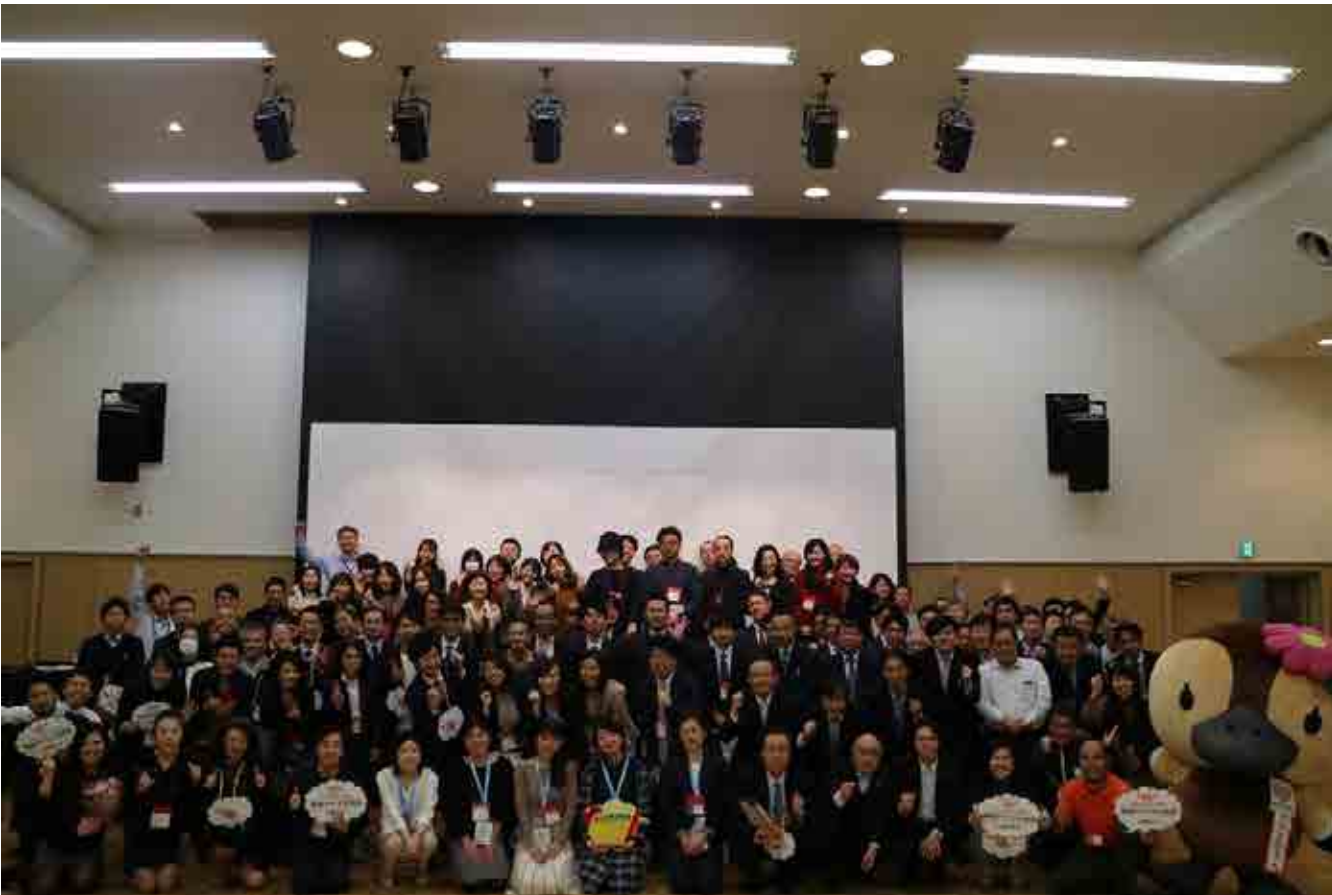
第10回江東区ちいきクラウド交流会