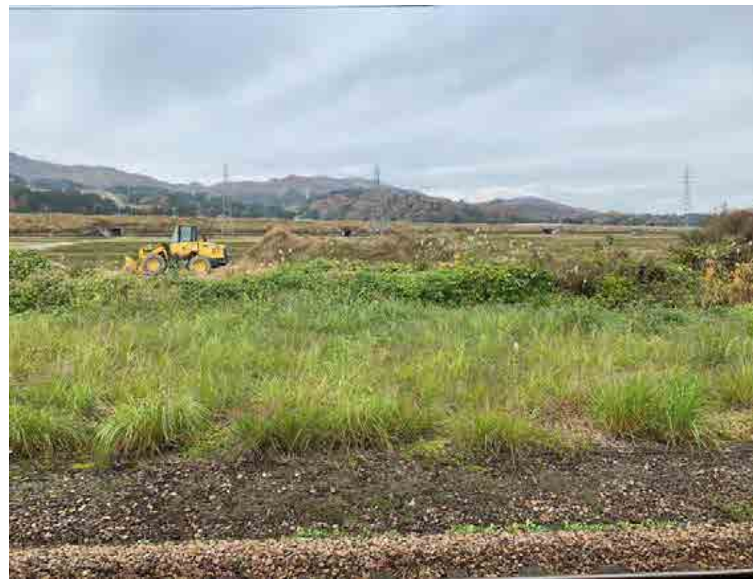
塩沢駅のホームからの風景