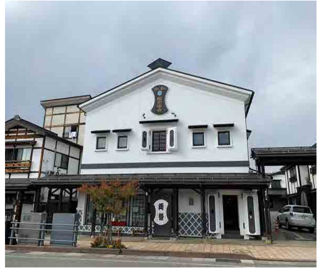
塩沢信用組合本店