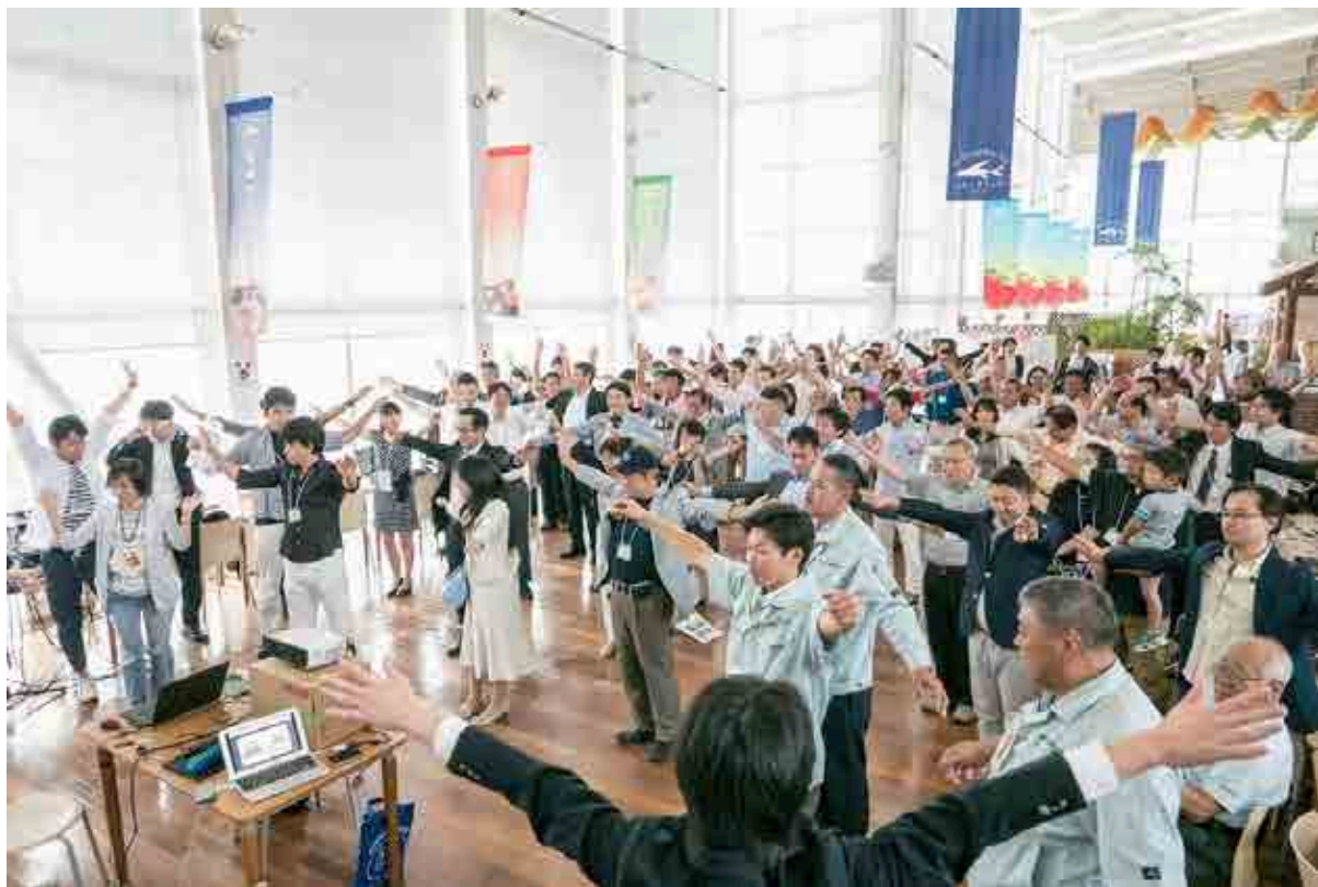
ちいきクラウド交流会における大人の本気の「ラジオ体操」