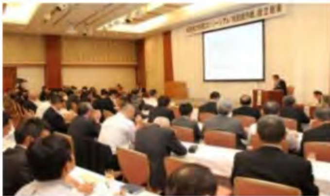
(2013年9月17日設立総会の様子)