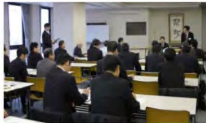
(地域振興班会議中の様子)