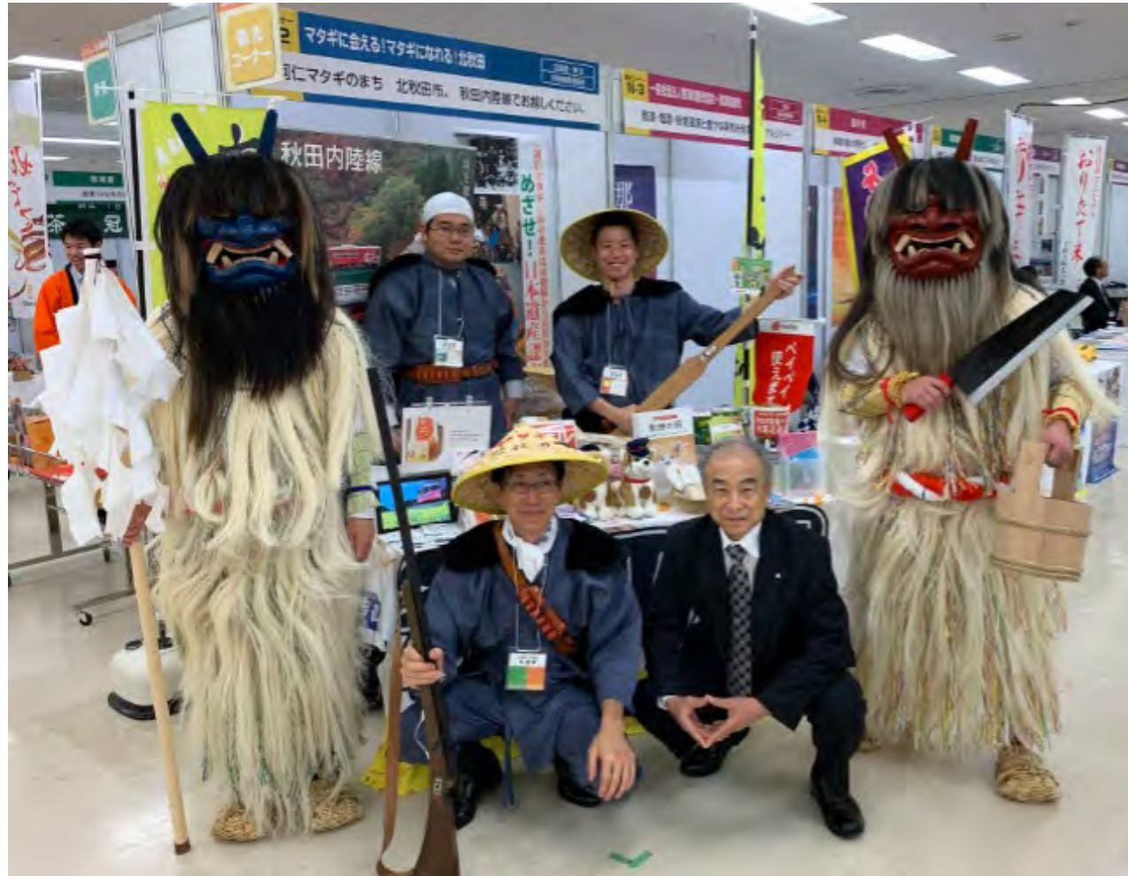
販促活動のためなまはげになる信組職員